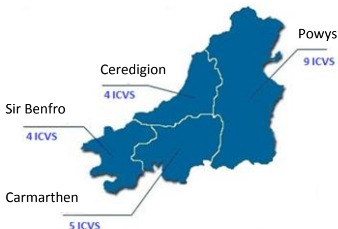
Ffigwr 1: Nifer yr Ymwelwyr Annibynnol â'r Ddalfa ym mhob Ardal Panel

Gwneir pob ymdrech i sicrhau bod y Cynllun yn cynrychioli demograffeg Dyfed-Powys, ond yn hollbwysig, gwirfoddolwyr sy'n medru rhoi amser ac ymrwymiad i'r cynllun sy'n cael eu dewis i gymryd rhan.